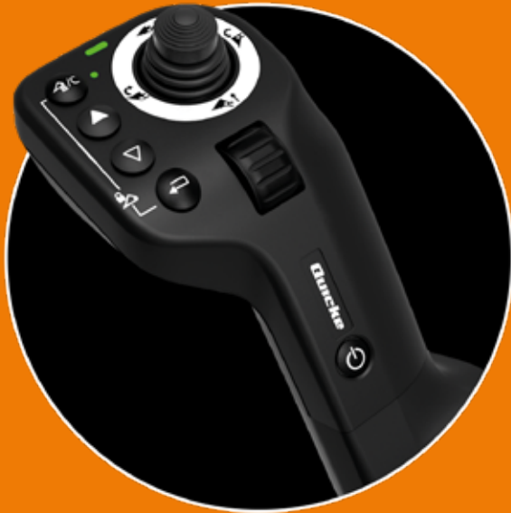
Q E -command